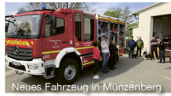
Neues Fahrzeug in Münzenberg