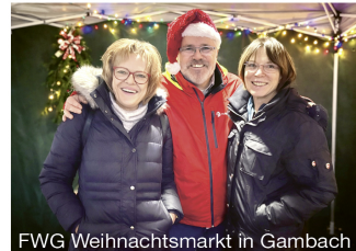
FWG Weihnachtsmarkt in Gambach