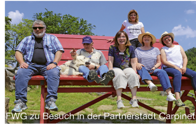
FWG zu Besuch in der Partnerstadt Carpinesi