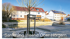
Sanierung Weehd Ober-Hörgern