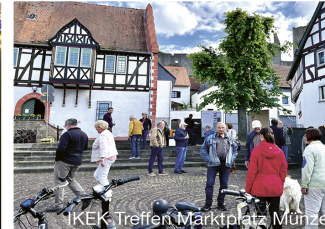
IKEK-Treffen Marktplatz Münzenberg