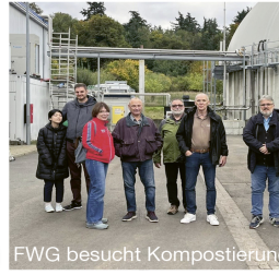
FWG besucht Kompostierung