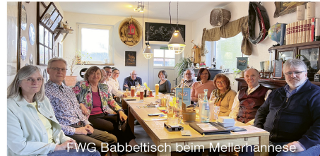
FWG Babbeltisch beim Meilernannese