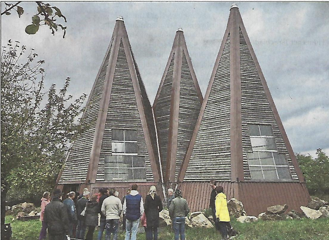
Die Spitztürme in Münzenberg beherbergen eine spannende Sammlung.